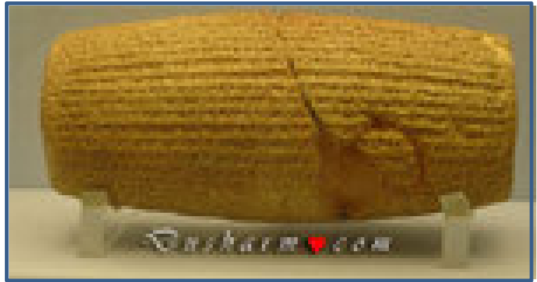
منشور حقوق بشر كوروش بر روى استوانه گلى (موزه انگلستان)

آن گاه که بدون جنگ و پیکار وارد بابل شدم، همه مردم گام های مرا با شادمانی پذیرفتند. در بارگاه پادشاهان بابل بر تخت شهریار نشستم. مردوک خدای بزرگ دل های پاک مردم بابل را متوجه من کرد... زیرا من او را ارجمند و گرامی داشتم. ارتش بزرگ من به صلح و آرامی وارد بابل شد. نگذاشتم رنج و آزاری به مردم این شهر و این سرزمین وارد آید. وضع داخلی بابل و جایگاه های مقدسش قلب مرا تکان داد... من برای صلح کوشیدم. من برده داری را برانداختم، به بدبختی آنان پایان بخشیدم. فرمان دادم که همه مردم در پرسش خدای خود آزاد باشند و آنان را نیازارند. فرمان دادم که هیچ کس اهالی شهر را از هستی ساقط نکند. مردوک خدای بزرگ از کردار من خشنود شد... او برکت و مهربانی اش را ارزانی داشت. ما همگی شادمانه و در صلح و آشتی مقام بلندش را ستودیم... من همه شهرهائی را که ویران شده بود از نو ساختم. فرمان دادم تمام نیایشگاه هائی که بسته شده بودند را بگشایند. همه خدایان این نیایشگاه ها را به جاهای خود باز گرداندم. همه مرمانی که آورده و پراکنده شده بودند را به جایگاه های خود برگرداندم و خانه های ویران آن ها را آید کردم. همه مردم را به همبستگی فرا خواندم. همچنین پیکره خدایان سومر و آكد را که نبودید بدون واهمه از خدای بزرگ به بابل آورده بود، به خشنودی مردوک خدای بزرگ و به شادی و خرمی به نیایشگاه های خودشان باز گرداندم. بشود که دل ها شاد گردد. بشود خدایان که آنان را به جایگاه های نخستین شان باز گرداندم، هر روز در پیشگاه خدای بزرگ برایم زندگانی بلند خواستار باشند. بشود که سخنان پر برکت و نیک خواهانه برایم بیابند.